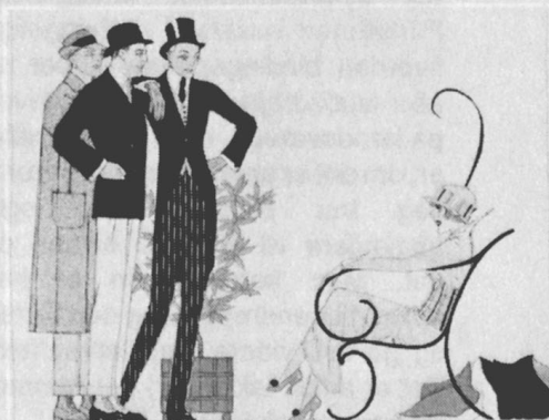
Nyt Nordisk Forlag Arnold Busck · Nationalmuseet

Udsnit af plakat, tegnet af Sven Brasch i 1914, der reklamerede for English House i København.