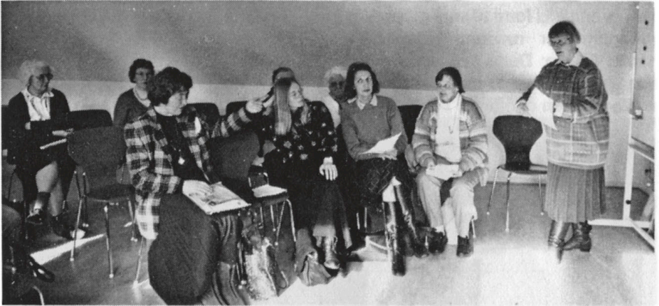
Generalforsamling i museets mødelokale.