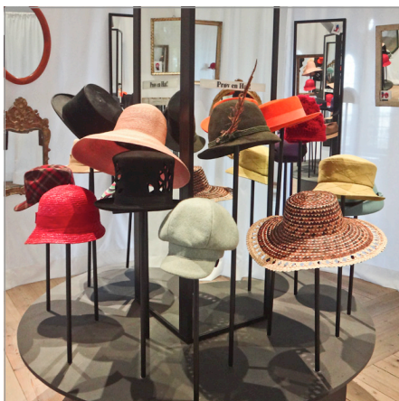
Prøv en hat i Rundetaarn juni 2014.