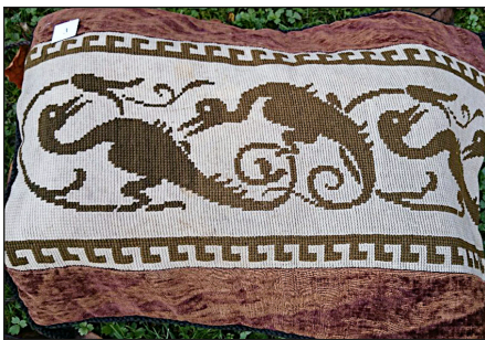
Disse puder kan godt være Elise Konstantin-Hansens værk. Hun arbejdede meget med motiver fra naturen og især fugle havde hendes interesse. Motiverne var indrammet af geometriske borter.