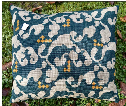
Poden her er broderet med korssting i blå, beige og gyldne farver. Det ligner meget et af Thorvald Bindsbølls mønstre.