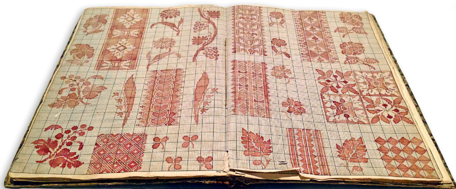
Mønsterbog Uindbundet mønsterbog fra Køng Fabrik.

Væverlærlingene i Køng blev om søndagen undervist i tegning af mønstre til drejl og damask. Der er bevaret fire mønsterbøger udført af lærlinge. Som svende supplerede de derefter bøgerne med nye mønstre efter behov.