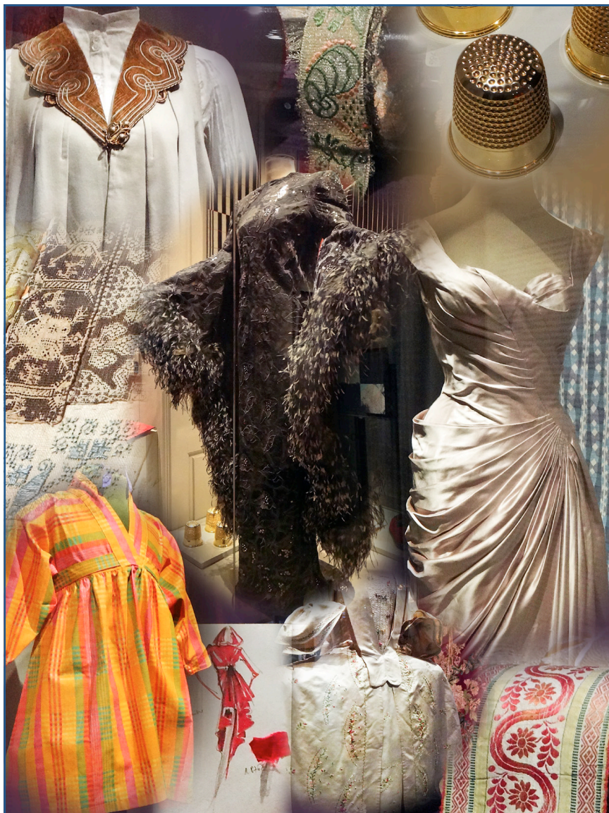
INDTRYK FRA EN TUR TIL MODE&TEKSTIL USTILLING I DESIGNMUSEET - FOTODÉCOUPAGE - SE OGSÅ KALENDERBLADET