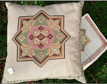
Her er en broderet pude, hvor mønsteret ikke er blevet fulgt mht. rammeborten!