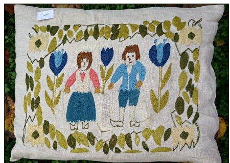
Lille pude i almestil syet med uld på bør.