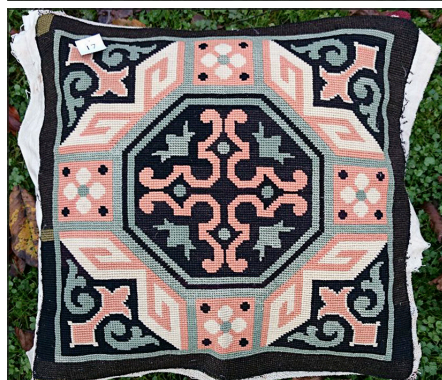
Mønstre inspireret af mosaikgulve i museer og slotte.