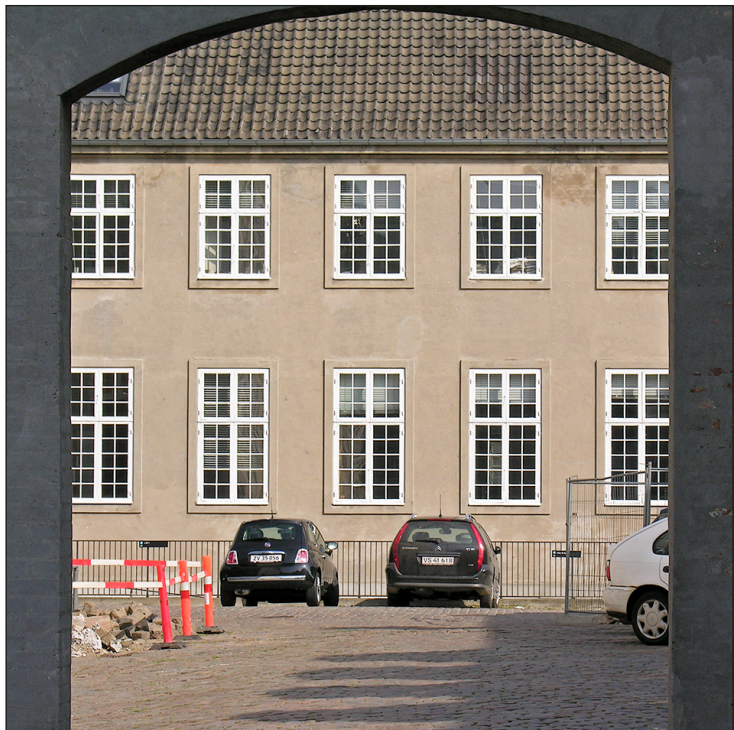
Bredgade 74 i 2012 – set gennem porten fra Designmuseets forplads.

Straks naar man kommer inden for i den fornemme Bygning, budt Velkommen af de fine klassiske Palmer, der er indsebet i Forstuens