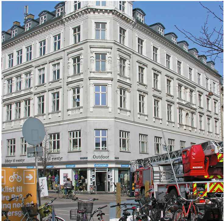
Frederiksborggade 32 i 2012. Tekstilformidleruddannelsen, Håndarbejdets Fremme holder til i etagerne over sportsforretningen.

Som en del af de nye rammer fik Håndarbejdets Fremme en dimensionering på optaget på ca. 30 nye studerende om året – det var en nedtur – og en ny uddannelsesbekendtgørelse: en 3½-årig profes-