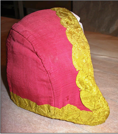
Puldhue fra Hjørring.