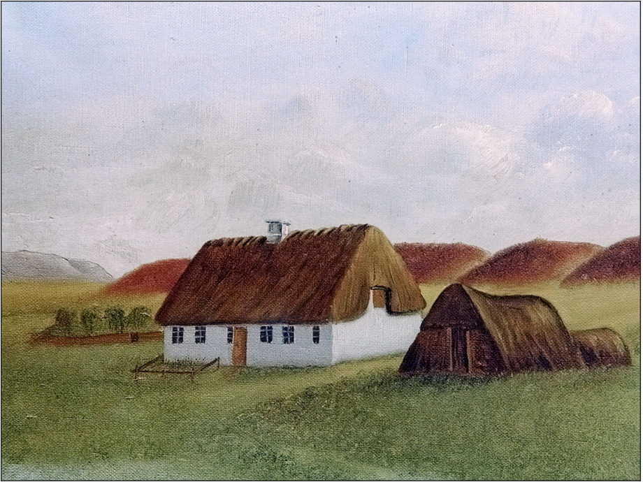
Amatørmaleri af et simpelt arbejderhus, som lå på marken lidt syd for fabrikken. Huset var delt mellem to familier.

beskæftiget foruden 36 voksne, og i de følgende år gjorde han den erfaring, at "vanskelighederne med oplæring af dansk arbejdskraft ville løse sig, efterhånden som børn tilføres i vore fabrikker og der derved opstår en dygtig arbejderstand".