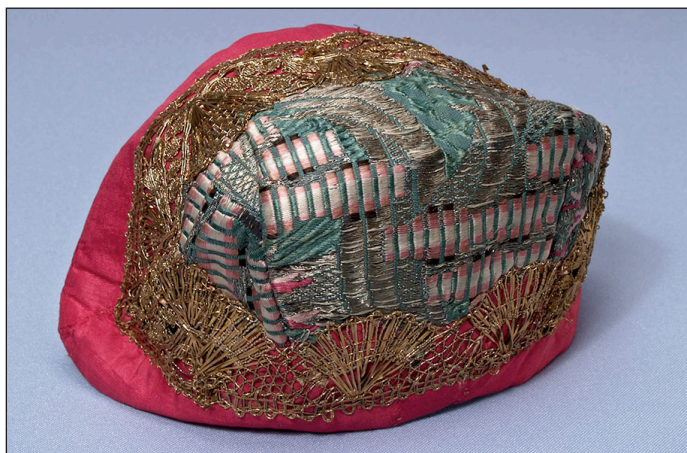
Tre-styks hue fra Roskilde.

I de tilfælde, hvor en tidlig dåbsdragt med 2 tilhørende huer er bevaret, drejer det sig næsten altid om en 3-styks og en 6-styks hue med klassisk udseende. Huerne har undertiden fået supplerende pynt på gennem tiderne, så det klassiske udsende er camoufleret lidt.