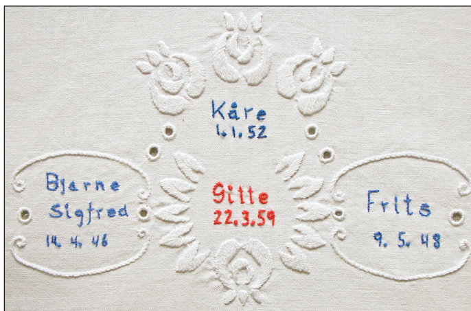
Navne på dåbskjole 1946 til 1959.

tidsrum, at man for alvor begyndte at brodere navne og undertiden årstal på de hvide dåbskjoler. Der er indtil videre ikke noget der tyder på at skikken er blevet almindelig meget tidligere.