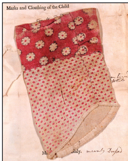
Tøjprøve: Ærme fra baby-trøje 1746. To slags trykt lærred.

som The London Foundling Hospital's arkiver, der indeholder verdens største samling af tøjprøver på dagligtøj fra 1741 til 1760 (s. 333). Alle hittebørn som blev optaget i stiftelsen blev registreret med identifikationsnummer, og påklædningen blev dokumenteret med en tøjprøve eller dragtdel – til brug for opklaringen af barnets herkomst.