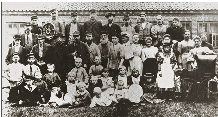
Tekstilarbejdere på klædefabrikken. De mindste børn hjalp hjemme deres mødre med at nople klæde, mens de større fik arbejde på fabrikken.