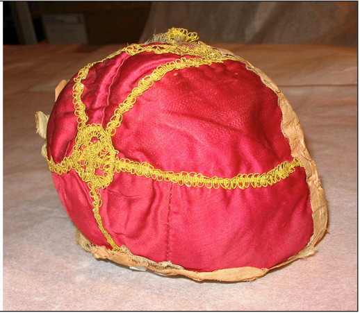
5-styks hue fra Hjørring.