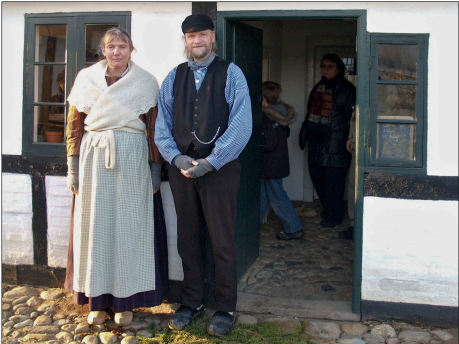
Kom og se til os – I skal være så velkomne på Hjerl Hede i 2009.

Til aftenunderholdning på Vandrerhjemmet vil vi gerne opfordre til, at tage noget med, enten for at vise frem eller for at fortælle om det. Måske er nogen blev inspireret på årets generalforsamling og har siden fundet flere lommeværklæder