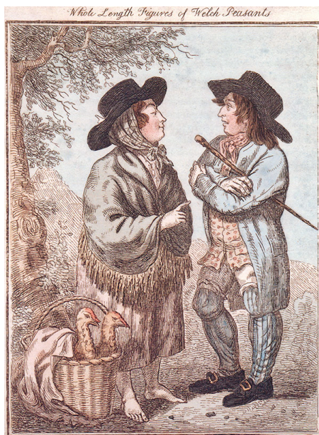
Walisiske almuefolk 1797.

Talrige andre kilder som memoarer, annoncer, tingbøger og skifter anvendes, og af materialet skabes en syntese, som fortæller at folk gjorde utrolig meget ud af deres dragt og udseende. Man har brugt en del penge på det – flere end man umiddelbart ville tro – og har så vidt muligt fulgt moden og foretrukket behagelige stoffer som bomuld frem for den kradsende vadmel. Ydermere har folk fra meget beskedne kår brugt strømper, silketørklæder og sko med spænder, hvis det på nogen måde var indenfor rækkevidde. Udenlandske iagttagere har ofte berettet, at den engelske underklasse klædte sig "over sin stand", og det dokumenteres således med denne bog og end-