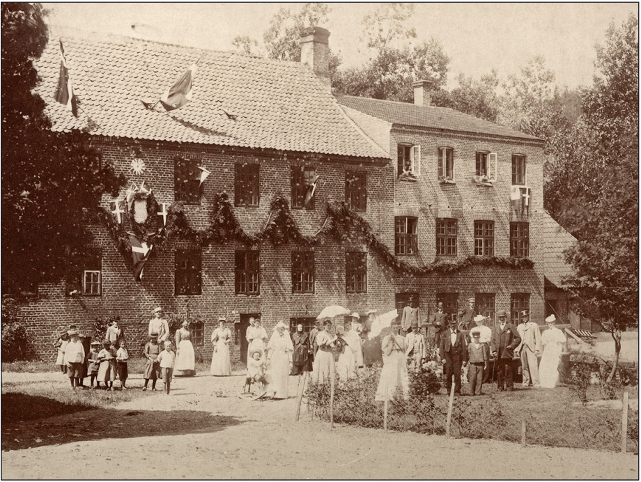
Klædefabrikken set fra gårdspladsen, indfanget i forbindelse med virksomhedens 50-års jubilæum i 1871. Vandhjulene er erstattet af en vandturbine, og fabrikken har fået en mindre dampmaskine som supplement.